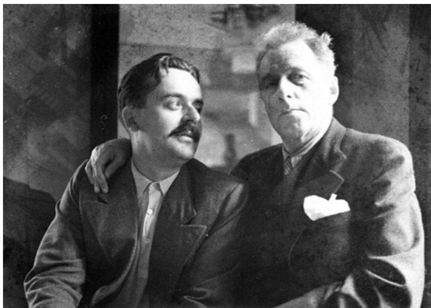
Unikátní foto s Vsevolodem Mejercholdem

rozbijím tonalitu, odstraňuji konvenční výtahy taktů... A až se dostanu k melodii, budu teprve na okraji neprobádaných a svůdných hloubek.